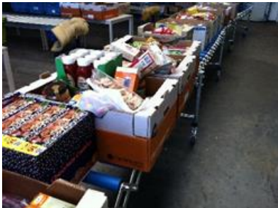
7) De hongerigen voeden