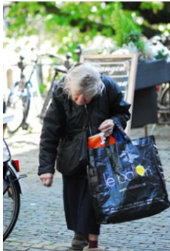
2) 2 e Prijs