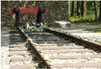
5) De gevangenen bezoeken