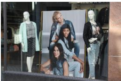
4) de naakten kleden

Formaat 50x60 uitgevoerd in plexiglas hoogglans