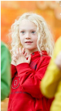
17) Blonde jongen