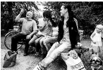
18) Park wezenlanden