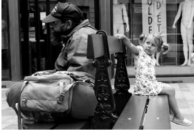
1) 1 e Prijs

Formaat 60x70 uitgevoerd in plexiglas hoogglans