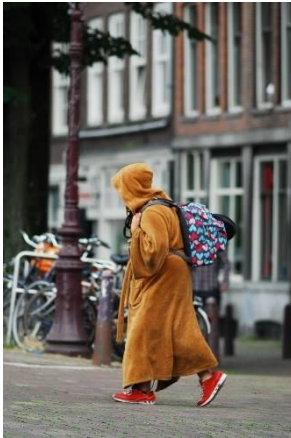
16) Vrouw in oker