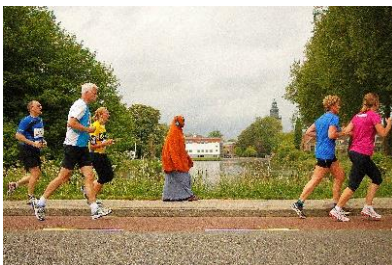
8) De vreemdeling opnemen