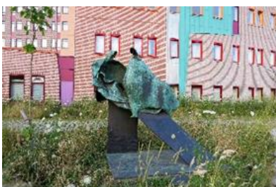
10) De zieken bezoeken