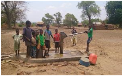
6) De dorstigen laven