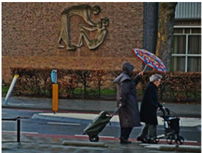
3) 3 e Prijs

Formaat 50x60 uitgevoerd in plexiglas hoogglans