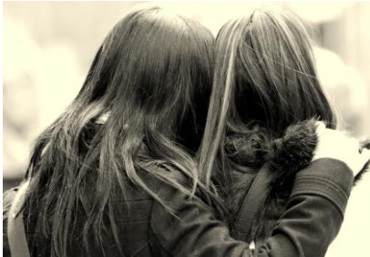
20) Twee meisjes