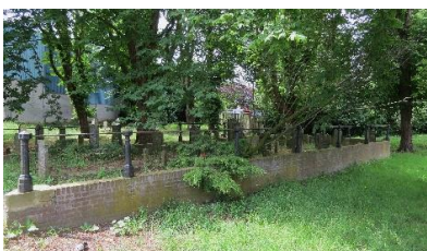
9) De doden begraven