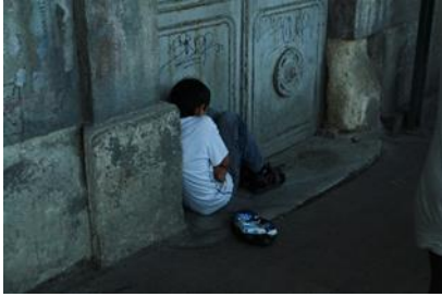
19) Jongen in portiek