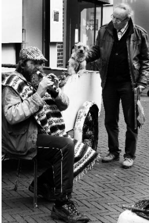
15) Man met blokfluit